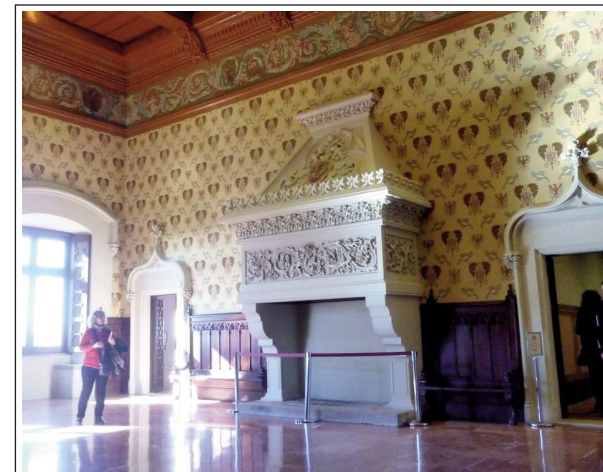
CASTELL DE CASTELLDEFELS. Interior.

Encara que el lloc està documentat al segle X com a kastrum Felix o Castrum Feles i posteriorment com Chastello de Fels , la primera edificació fou l'església, i el castell va ser bastit en diverses etapes bastant posteriors. A causa de la inestabilitat política dels segles XIV i XV, l'església es va fortificar. Documentació de l'època diu que, a més del temple, hi havia una