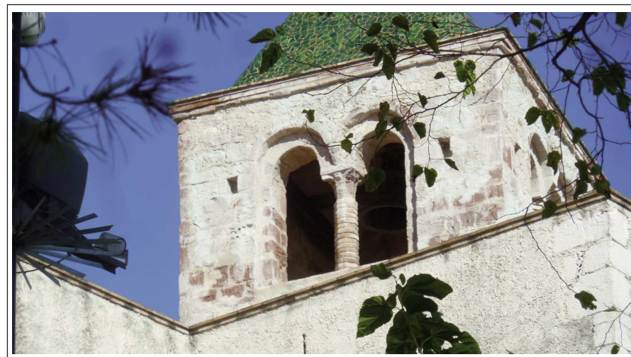
SANTA MARIA DE CASTELLDEFELS. Campanar.

El castell de Castelldefels s'alça dalt d'un turonet que domina la zona sud del delta del Llobregat. Fou construït damunt de les restes d'un poblat ibèric i d'una posterior vil·la romana. La primera edificació va ser l'església de Santa Maria. Molt més tard es bastí, en diverses etapes, el castell.