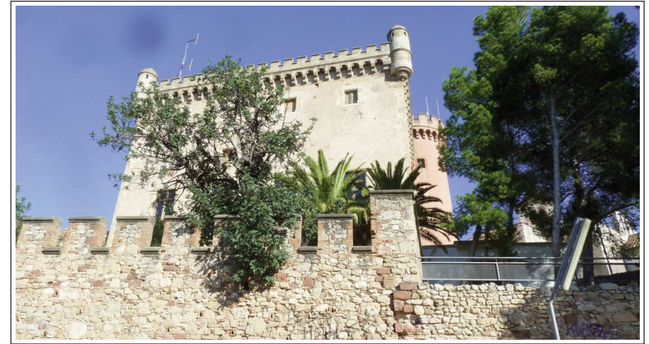
CASTELL DE CASTELLDEFELS.