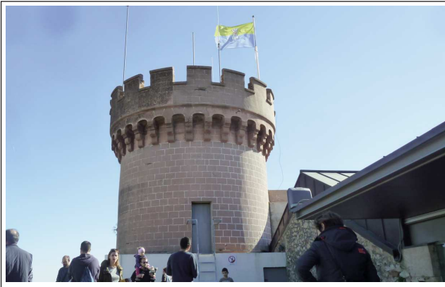
CASTELL DE CASTELLDEFELS. Torre.

El primitiu temple preromànic és esmentat l'any 967, en el testament de Galí de Santmartí, que deixava la major part dels seus béns a Santa Maria, per tal que s'edifiqués un monestir, però no s'arribà a construir. Quatre anys més tard, el comte de Barcelona