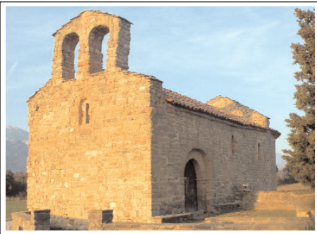
SANTA MARIA D'AVIÀ