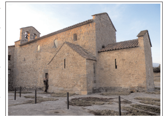
SANT VICENÇ D'OBIOLS. Església.

Al segle XIII, la coberta existent, d'encavallada de fusta, fou substituïda per una volta apuntada de canó, cosa que comportà el doblement dels murs. A finals del segle XVI, amb la creació del nou bisbat de Solsona havia de canviar de diòcesi. Per mitjà d'una concòrdia, no s'efectuà. Encara al 1753, hi hagué un plet, que es resolgué de la mateixa manera. Fou finalment, el 1874, que passà definitivament a la diòcesi de