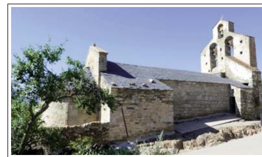
SANT ESTEVE DE GUILS DE CERDANYA.

Església documentada a finals del segle X relacionada amb Sant Martí del Canigó i més especialment amb la Seu d'Urgell. És un dels edificis més característics de l'arquitectura romànica del segle XII de la Cerdanya. Destaca pel campanaret d'espandanya de tres ulls i, sobretot, pel treball escultòric de les cornises, de l'absis i del portal. Té una sola nau coberta amb volta apuntada.