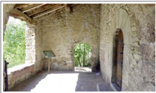
SANT MARCEL DE BOR. Porxo.

Se situa a l'extrem alt del petit nucli de Bor, al sud-est de Bellver, en un lloc privilegiat, des d'on es divisa una bona part de la Batllia de Bellver i de les muntanyes pirinenques. És molt coneguda dels espeleòlegs la Tuta de la Fou de Bor , un conjunt de grutes de gairebé 5 km de galeries, que recorre les entranyes del Moixeró. L'església de Sant Marcel figura a l'acta de consagració de la Seu d'Urgell de l'any 839, amb el nom de Borre .