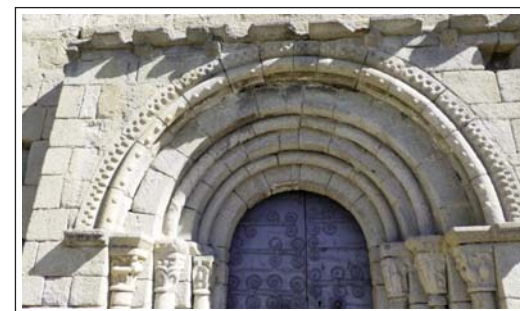
GUILS DE CERDANYA. Decoració del portal.

La façana principal te la cornisa amb diverses mènsules esculpides. El portal, el formen tres arcs de mig punt en gradació, dues arquivoltes i tres parells de columnes amb capitells esculpits. Emmarcant aquest conjunt hi ha un doble arc guardapols decorat amb mitges boles i amb un escacat. Damunt de la porta hi ha unes cartel·les que denoten l'existència d'un antic porxo.