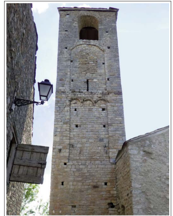
SANTA EUGÈNIA DE NERELLÀ. Campanar de torre.

De l'antiga edificació romànica de l'església només en queda el campanar, que és l'únic sencer dels tres que es conserven a la Cerdanya. És un campanar de torre, força esvelt, de 18,5 m per 3,40 m, de quatre cossos separats per frisos de decoració llombarda. A causa dels aiguats de 1982, que afectaren el sòl, la torre té una inclinació que li ha valgut el sobrenom de la Torre de Pisa de la Cerdanya .