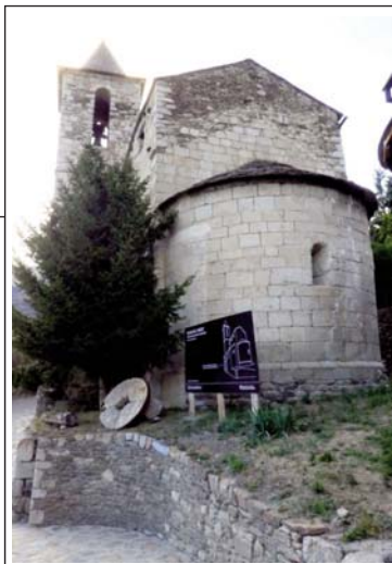
SANT SERNI DE MERANGES.

De Sant Serni de Meranges, com de moltes de les esglésies de la Cerdanya el primer document que en parla és l'acta de consagració de la Seu d'Urgell, del final del segle X, on s'esmenta amb el nom de Meranicos .