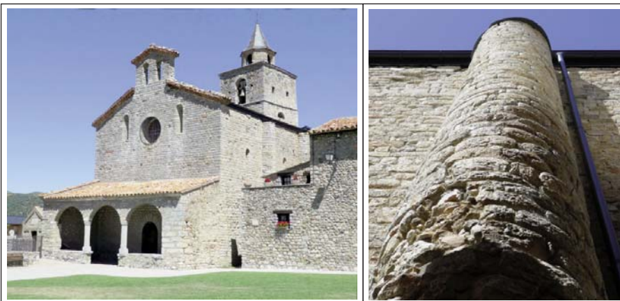
SANTA MARIA DE TALLÓ. La imatge de la dreta correspon a un dels contraforts semicirculars poc habitual en el romànic català.

És una església gran amb un absis molt alt, del segle XI i el presbiteri encara més alt, cobert amb volta de canó i limitat per la sagristia i pel campanar. La nau és posterior (segles XII, XIII) més baixa i dividida per quatre arcs torals, amb volta moderna. Exteriorment mostra uns contraforts semi-