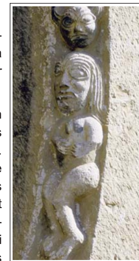
SANTA EUGÈNIA DE SAGA. Una de les escultures que decoren una arquivolta del portal.

Aquesta església, situada al capdamunt d'un turó, consta d'una sola nau, capçada per un absis semicircular i una part de la volta apuntada original. El portal, situat a la façana de migdia, consta de cinc arcs en gradació amb arquivoltes. L'externa és decorada amb figures esculpides. Abraçant-ho tot hi ha un guardapols que emmarca una dovella central amb la figura de Crist esculpida. A banda i banda dels brancals hi ha dos parells de columnes amb motlures a les bases i al capdamunt capitells esculpits amb motius animals i vegetals.