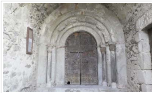
SANT SERNI DE MERANGES. Portal.

El municipi de Meranges abraça, gairebé, la totalitat de la vall Tova formada per la conca fluvial del Duran, afluent del Segre. La vila, endinsada a la vall, és a 1539 m d'altitud.