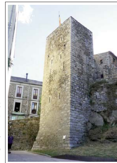
BELLVER DE CERDANYA. Torre de la Presó.

És una vila amb una data de naixement molt precisa, el 1225, quan el comte Nunó Sanç de Rosselló i Cerdanya va atorgar-hi carta de poblament i franquícies per donar entitat al castell de Talló, anomenat Bello Videre . L'objectiu era salvaguardar la frontera amb el comtat d'Urgell. Jaume I el