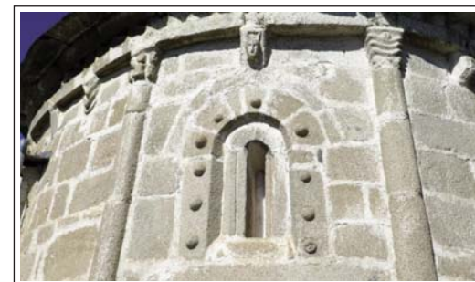
SANT ESTEVE DE GUILS DE CERDANYA. Detalls de l'absis.

De l'exterior de l'absis cal tenir en compte la cornisa de dents de serra, sostinguda per mènsules esculpides i dues mitges columnes adossades amb capitells decorats. La finestra central consta de dues arcades, amb l'exterior decorada amb mitges boles.