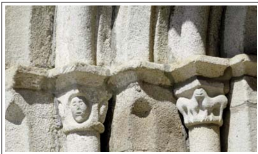
SANTA CECÍLIA DE BOLVIR. Capitells del portal.

Bolvir és un poblet d'uns 280 habitants, situat a 4 km a l'oest de Puigcerdà. L'església parroquial de Santa Cecília té un aspecte impecable. És esmentada per primer cop l'any 958, dins les possessions del monestir de Cuixà.