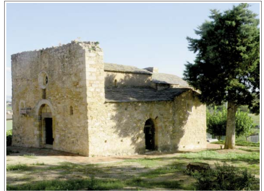
SANT JOAN DE BELLCAIRE D'EMPORDÀ.

L'església està en un indret on es varen trobar vestigis romans. Encara que el primer document conegut és una butlla papal de l'any 1002, les excavacions realitzades varen determinar l'existència de dos temples anteriors preromànics. Fou la parroquial fins al segle XVII o XVIII, en què passà a ser-ho la del castell i aquesta esdevingué la capella del cementiri. Els anys 50