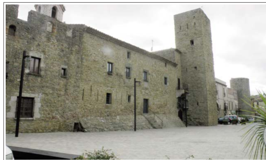
VERGES. Muralls medievals.

És un municipi situat a la riba esquerra del riu Ter. El primer document conegut, de l'any 959, cita villa Virginibus , en canvi, el castell no apareix fins al segle XII. Al redós del castell es construï la vila. Fou emmurallada als segles XIII i XIV. Experimentà un gran creixement, entre els segles XVII i