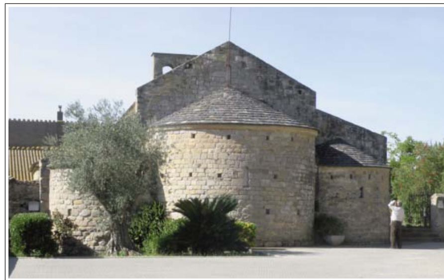
SANT TOMÀS DE FLUVIÀ. Capçalera.

L'edifici fou bastit als segles XIII-XIV, en estil gòtic. És de planta quadrada, consta d'un pati central i dos cossos. El de ponent, possiblement era l'aula major, està format per quatre arcs apuntats de diafragma que inicialment sostenien un enteixinat. Posteriorment, en època barroca, fou substi-