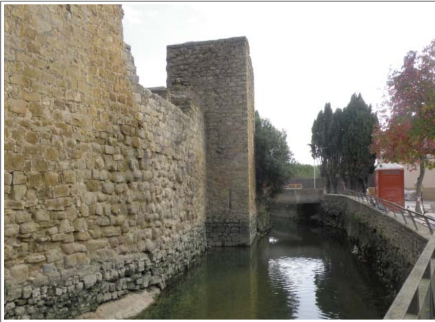
VERGES. Fossar amb el rec del Molí.

Dins del recinte emmurallat trobem: les restes de l'antic castell del segle XII (només queda un mur), en l'edifici del actual ajuntament, i l'església parroquial de Sant Julià i Santa Basilissa. L'absis semicircular i el mur de llevant són romànics (segle XII-XIII), la resta és neogòtic (segle XVII-XVIII), llevat del campanar que és neoclàssic (segle XIX). Verges és coneguda arreu, per la processó del Dijous Sant on es balla la Dansa de la Mort d'origen medieval.