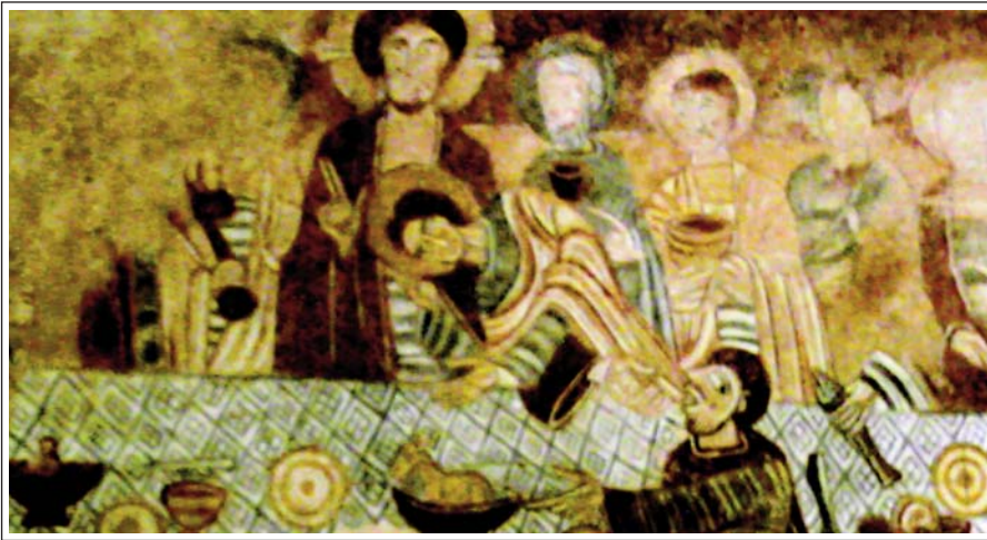
SANT TOMÀS DE FLUVIÀ. Pintures murals. Fragment amb el Sant Sopar.

A l'exterior de cada absis i també damunt del central s'obre una finestra d'esqueixada simple i arc monolític. La façana de ponent (reformada tardanament), consta d'una porta adovellada de mig punt i un ull de bou. Està coronada per un campanar de cadireta. A l'interior es conserven dos conjunts de pintures murals romàniques molt interessants, un a la conca de l'absis i l'altra a la volta de la nau, segurament d'artistes diferents. El primer és segurament de finals del segle XII, és de millor qualitat, s'hi representa la clàssica teofania, Crist en Majestat dins una màndorla, ricament decorada, rodejat pel tetramorf. A més, al costat esquerre hi ha l'arcàngel Miquel i un querubí; al dret, l'arcàngel Gabriel i un altre querubí. Als costats de la volta es representen dotze (la meitat) dels ancians de l'Apocalipsi, en quatre grups de tres. En el segon, a la volta de la nau, i de menor qualitat, datat segurament a inicis del segle XIII s'hi representa: l'entrada de Jesús a Jerusalem (dia de Rams), el Sant Sopar (Judes menja de la mà de Jesús i a la mà dreta té la bossa de les monedes), l'empresonament de Jesús, la Crucifixió i el sepulcre amb les tres Maries.