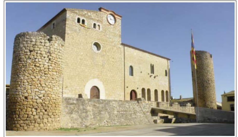
CASTELL DE BELLCALRE D'EMPORDÀ.

La vila està situada a dalt d'un petit turó des del qual es domina tota la plana. En direcció nord, hi havia l'estany de Bellcaire que, a mitjan segle XVIII, fou dessecat per convertir-lo en terres de conreu. El rec del Molí