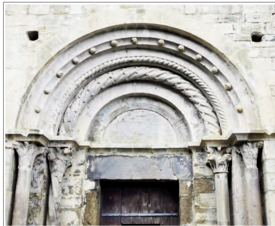
SANT CRISTÒFOL DE BEGET. Detall del portal.

La pica baptismal és romànica i gran. Mesura 120 cm de diàmetre i és decorada únicament amb dos cordons horitzontals. També hi ha una tosca pica rectangular per guardar l'oli de les llànties. És molt antiga, però sense datar.