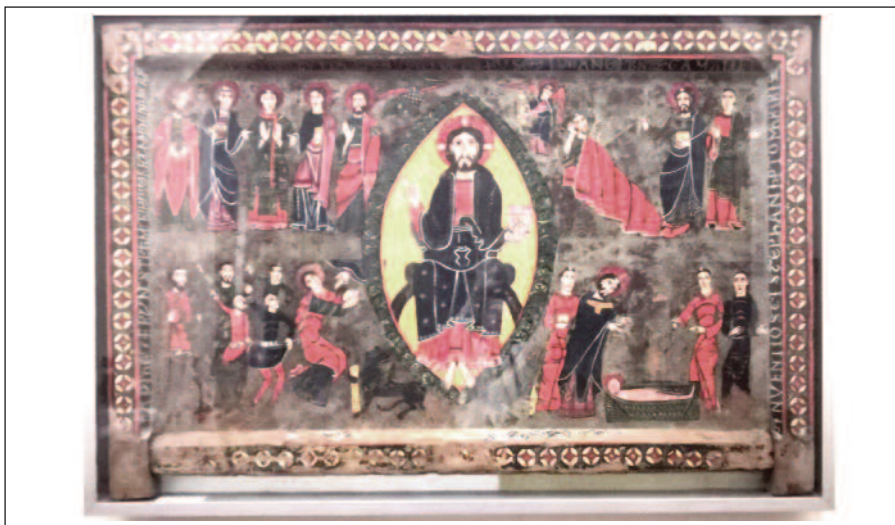
SANT ESTEVE DE LANARS. Frontal de l'altar.