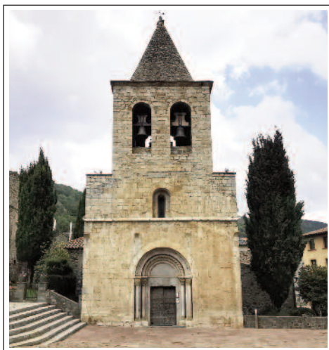
SANT ESTEVE DE LLANARS

El campanar, originàriament d'espadanya, amb dos ulls, fou convertit en una torre quadrada.