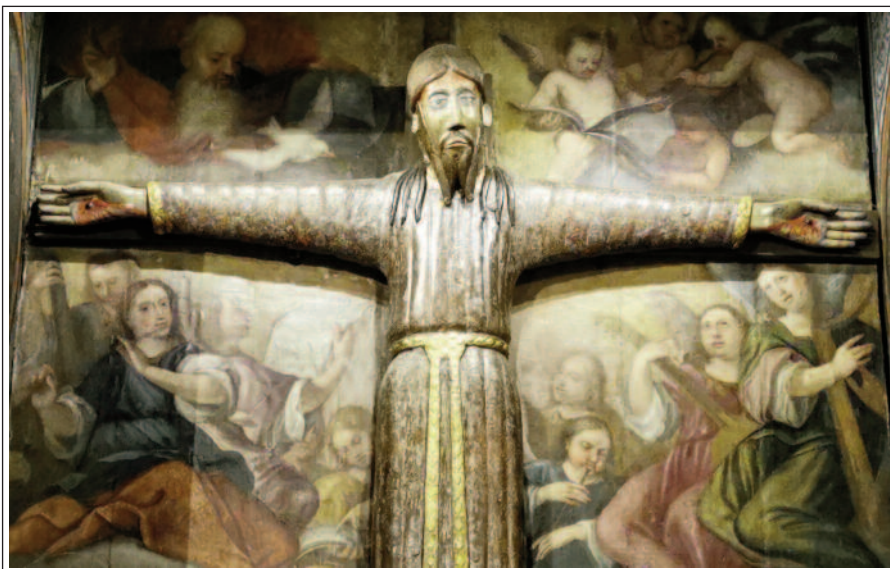
LA MAJESTAT DE BEGET

A l'interior el més destacable és la Majestat de Beget, una magnífica imatge romànica del segle XII, de fusta de noguera policromada, de 2 m d'alçada. Cal destacar la rica túnica i especialment el seu rostre. És una obra cabdal de l'escultura romànica, de les poques que es conserven in situ .