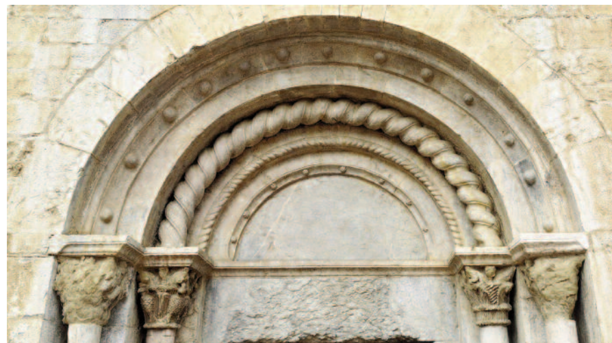
SANT ESTEVE DE LLANARS. Detall del portal d'entrada

Al mur de ponent s'obre el portal d'entrada. És molt similar al descrit per a Sant Cristòfol de Beget. La ferramenta de la porta és una bonica mostra de la típicament romànica, amb tires de ferro cargolades.