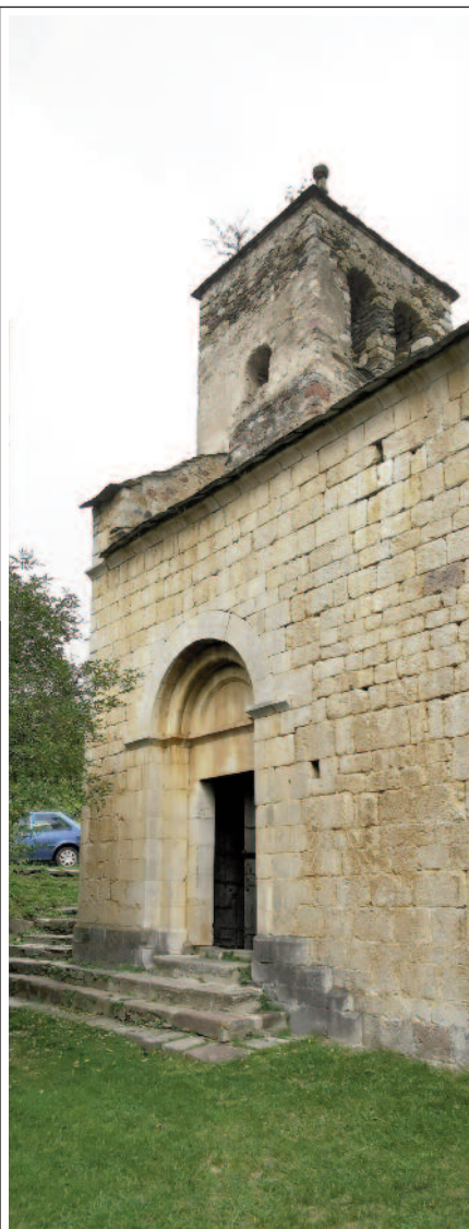
SANT FELIU DE ROCABRUNA. A l'esquerra, l'absis. A la dreta el portal i part del campanar.