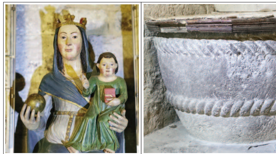
SANT CRISTÒFOL DE BEGET. Imatge d'alabastre policromat de la marededéu de la Salut, realitzada entre els segles XIV i XV i pica baptismal d'immersió romànica d'1,20 m de diàmetre.

nes, ràfecs de fusta i balconades. Les últimes construccions, del segle XIX, ja són amb balcons amb baranes de ferro i amb alguna façana decorada. Finalment, al segle XX, seguint la moda imperant, es van repicar tots els murs eliminant l'arrebossat de les façanes. El municipi va ser declarat conjunt historicoartístic l'any 1983.