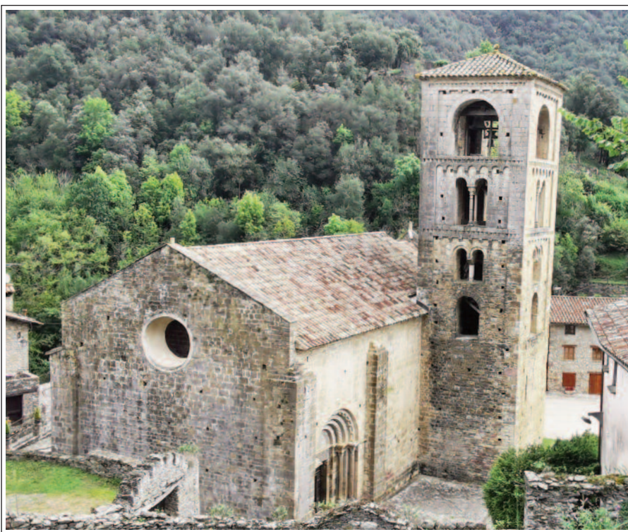
SANT CRISTÒFOL DE BEGET.

Les cases de Beget són amb murs de pedra, lligades amb morter de calç, generalment assentades sobre la roca. Les façanes, inicialment, eren arrebossades i pintades. Fins a finals del segle XVIII no van patir modificacions, però a partir de llavors, i fins a mitjans del XIX s'introduïren barbaca-