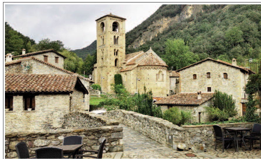
BEGET. Imatge d'una part de la població amb l'església romànica al centre

L'antic municipi de Beget està situat a l'extrem NO de la comarca de la Garrotxa, a una altitud de 526 m. Els inicis de la vila són del segle XII i després va anar creixent. L'any 1846 s'hi van agregar un grup de masies disperses de les antigues parròquies rurals de Rocabruna, Bestracà i Salarsa