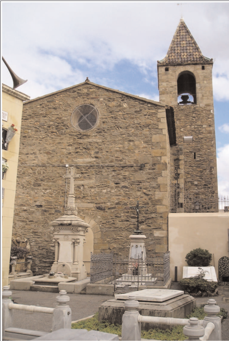
SANT GENÍS DELS AGUDELLS. Barcelona. Església parroquial i cementiri.