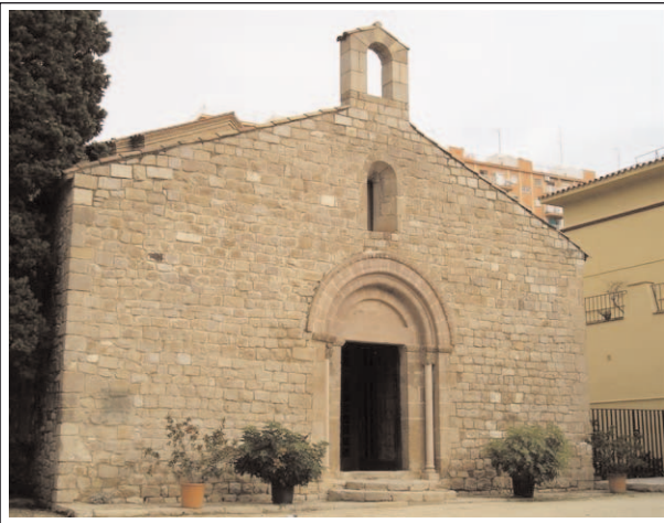
SANTA EULÀLIA DE PROVENÇANA.

a prop de Santa Eulàlia havia crescut un nucli de població, els veïns, que tenien la parròquia lluny, demanaren que s'obrís de nou l'església al culte regular i el 1879 es convertí en una nova parròquia del terme.