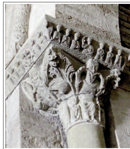
Gran capitell que sosté la part esquerra de l'arc triomfal.

Els terratrèmols de 1427-28 van malmetre l'edifici, sobretot l'església i el campanar. Aviat, el 1431, s'inicià la reconstrucció que s'allargà fins al 1530. Durant la Guerra dels Trenta Anys, el 1655, els francesos van destruir quasi totalment l'abadia. Al segle XVIII, fou reconstruïda en estil neoclàssic. És una barreja d'estils: l'església és barroca i neoclàssica, la portalada gòtica tardana i el claustre renaixentista tardà. Queden alguns petits vestigis d'època romànica. Amb la desamortització del 1835, va quedar abandonat, però tot seguit es va convertir en una casa missió del bisbat de Girona.