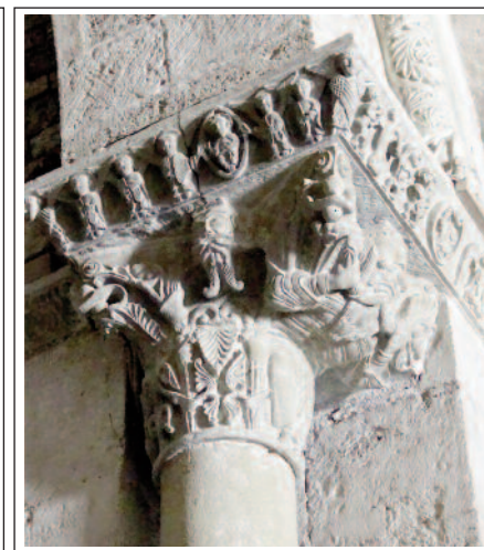
Gran capitell que sosté la part dreta de l'arc triomfal.

L'església consta d'una sola nau de grans dimensions coberta amb volta de canó, capçada per un absis semicircular amb un llarg presbiteri. Aquesta capçalera és ben singular. Té tres absidioles trevolades buidades al gruix del mur, en forma d'arcs de mig punt una mica peraltats, sostinguts per columnes amb capitells, amb decoració vegetal. A la part allargada hi ha, a cada costat, una capella també buidada en el mur. A l'absis hi ha encastada una biga de fusta policromada, que segurament prové del temple preromànic on se subjectava la cortina per ocultar l'altar, en el moment de la consagració.