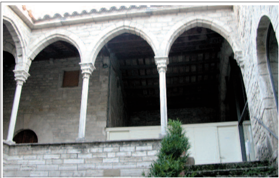
PIA ALMOINA.

Com s'ha vist es tracta d'un edifici molt complex, amb parts de factura arcaica però construït a finals del segle XII.