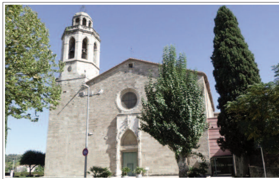
MONESTIR DE SANT ESTEVE DE BANYOLES.

La muralla medieval . Es conserva el tram que segueix el carrer de la Muralla.