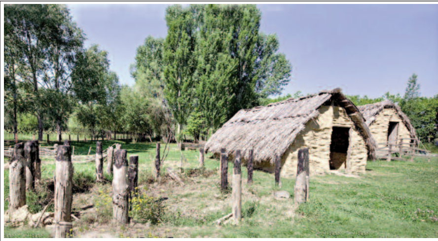
PARC NEOLÍTIC DE LA DRAGA. BANYOLES.