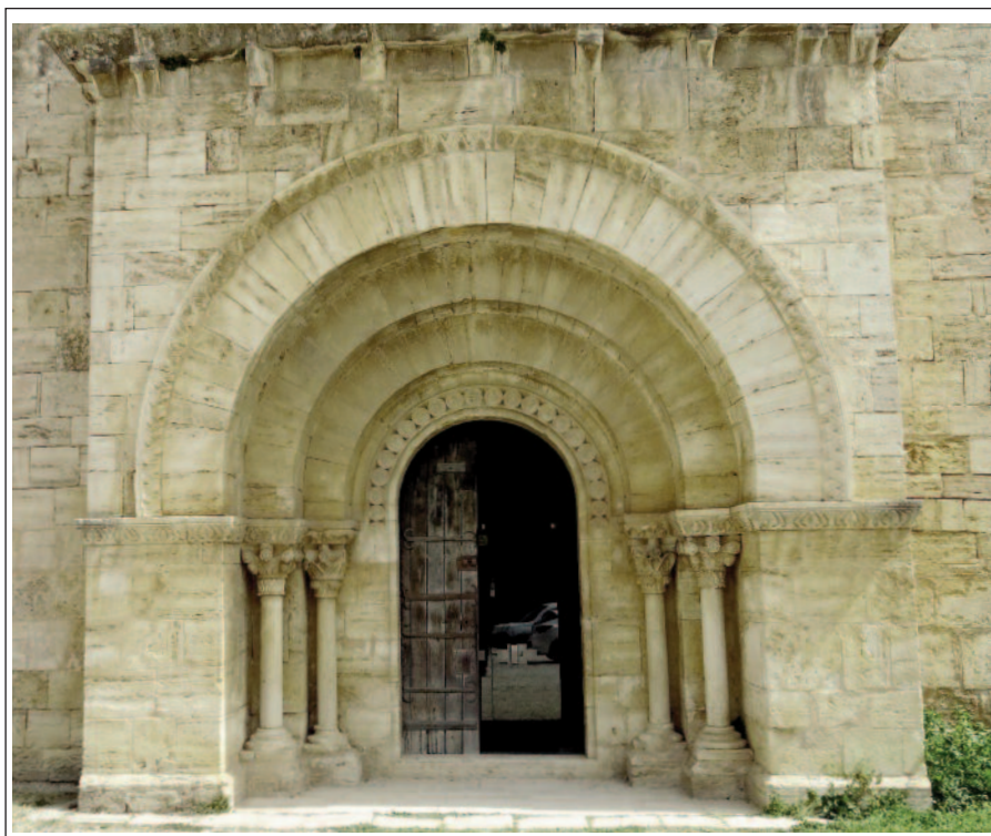
SANTA MARIA DE PORQUERES. Portalada.

Es va enderrocar el primitiu temple i se n'edificà un de nou, l'actual, encara que sembla que es van aprofitar algunes parts dels antics murs. L'acta de consagració de l'any 1182 cita la dedicació únicament a santa Maria; les seves importants possessions que amb els seus delmes li servien per a la seva subsistència; la creació d'una sagrera de trenta passes i la submissió de l'església a la jurisdicció de la seu de Girona. Actualment, el conjunt consta de l'església, a la seva dreta la rectoria i a l'esquerra el cementiri i un comunidor.