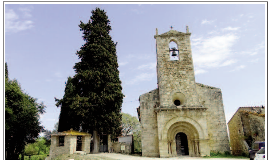
SANTA MARIA DE PORQUERES.

L'església de Santa Maria de Porqueres s'aixeca davant del Mas del Castell, antiga fortalesa medieval convertida en masia al segle XVII. En aquell lloc es van fer excavacions i es van trobar restes de petits nuclis de poblament d'èpoques ibèrica i visigòtica, un temple pagà i un de paleocristià.