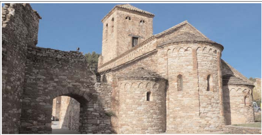
SANT ANDREU DE CASTELLNOU DE BAGES

La primera notícia documental que es conserva és de l'any 981. El 1126 passà a dependre de Sant Vicenç de Cardona. És un edifici romànic llombard del segle XI. Durant els segles XVI i XVII va sofrir una sèrie de transformacions importants. Es construï un massís campanar, es va obrir un portal, s'edificà un cor i se sobrealçaren les teulades laterals. Una de les absidioles es va suprimir per construir-hi la sacristia. L'any 1976 s'hi va fer una restauració durant la qual es restituï l'absidiola i l'alçada de les teulades laterals. El campanar es restaurà l'any 1992.