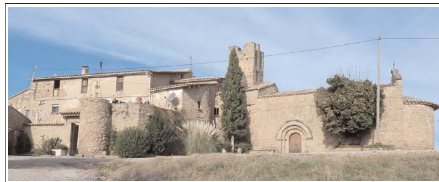
MASIA SOBIRANA I ESSLÉSIA DE SANT RAMON DE SOBIRANA DE FERRANS. Balsareny.

Curiosa església formada per dues naus, de llargada desigual. Té tota l'aparença d'una construcció que es començà a fer pensant que havia de tenir tres naus i forma basilical, o bé planta de creu llatina, amb un potent campanar. La realitat, però sembla que un cop començada, segurament per manca de diners s'acabà una mica com es va poder. Així doncs el temple actual disposa d'una nau principal coberta amb una volta de canó apuntada