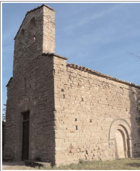
SANTA MARIA DEL CASTELL DE BALSARENY.

És al costat de llevant del castell. Consta d'una sola nau, capçada per un absis semicircular. La porta primitiva s'obria al mur de migdia i actualment és tapiada. L'actual, moderna, és a la façana de ponent, damunt la qual s'alça el campanar d'espada-nya de dos ulls. La nau és coberta amb una volta de canó apuntada. La volta de l'absis també ho és. Nau i capçalera són unides per dues arcades en gradació. La nau és il·luminada per dues finestres de doble esqueixada, situades al mur sud. Hi ha una altra finestra d'aquestes característiques al centre de l'absis, decorada amb una arquivolta senzilla.