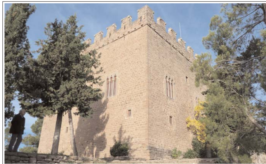
CASTELL DE BALSARENY

El poble de Balsareny té l'origen en el castell. El lloc és esmentat per primera vegada en un document l'any 951. Fou edificat al damunt d'una antiga construcció romana. L'edifici actual correspon a un tipus de palau