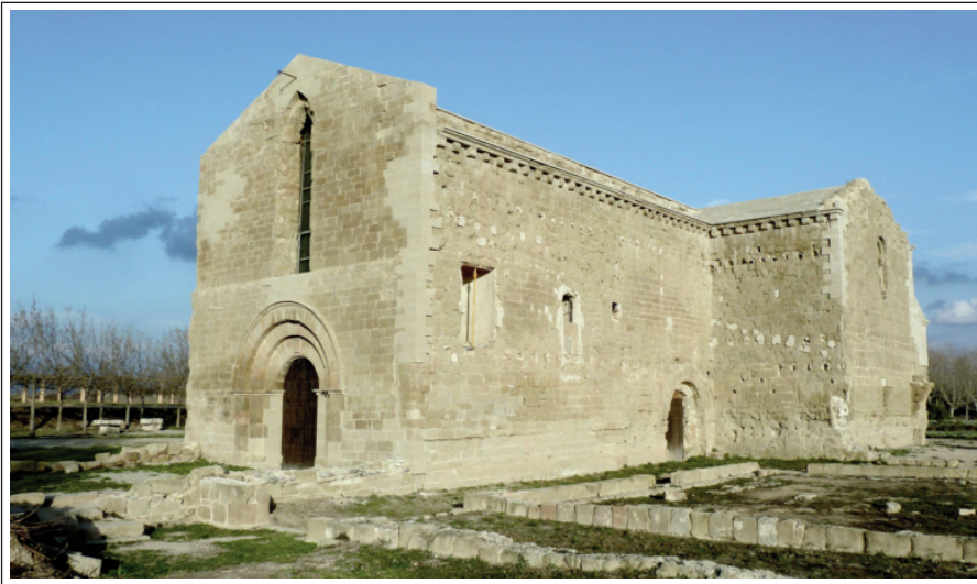
SANTA MARIA DE LES FRANQUESES. Balaguer.

ca i passà a ser un priorat masculí que depenia de Poblet. Després d'un període d'estabilitat tornà la decadència fins que el varen vendre a un particular de Balaguer i quedà convertit en quadra, habitatge i magatzem. Finalment, entre els anys 2012 i 2013 va ser rehabilitada l'església. Avui són visibles, a més de l'església, vestigis d'altres elements monàstics com el mur de tanca que l'envoltava i els espais dedicats a celler.