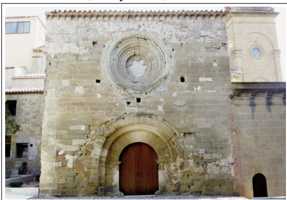
SANTA MARIA D'ALMATÀ, ara santuari del Sant Crist de Balaguer.

Santa Maria d'Almatà (ara santuari del Sant Crist de Balaguer). Al pla d'Almatà, des de l'època califal hi hagué la mesquita major de la ciutat. Posteriorment, l'any 1106, va ser convertida en església sota el nom de