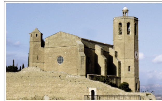
SANTA MARIA LA MAJOR. Balaguer.

Santa Maria la Major. Situada en un lloc elevat i vistós és un mirador privilegiat de la ciutat de Balaguer. S'alça al mateix lloc on anteriorment hi havia hagut una mesquita. És d'estil gòtic i es començà a construir l'any 1351 però va trigar molts anys a acabar-se. Fou consagrada el 1558. El 1836 va ser convertida en caserna i posteriorment en presó i dipòsit municipal i el 1881 fou restaurada al culte. El 1923 tornà a usar-se com a presó i una altra vegada en el període bèl·lic de 1936-39. L'edifici és cobert amb una volta estrellada i té una àmplia nau amb absis poligonal i capelles entre els contraforts laterals. El campanar és una torre poligonal amb una escala interior de cargol.