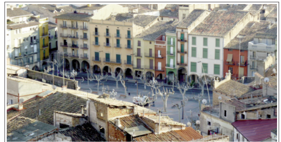
BALAGUER. Plaça del Mercadal vista des de Santa Maria.

Ciutat important de la Catalunya interior situada a la vora del riu Segre, que presumeix de ser l'única que ha conservat l'estructura urbana configurada pels sarraïns. Compta amb uns 17.000 habitants i dista uns 27 quilòmetres de Lleida. A la plaça del Mercadal, els dissabtes s'hi celebra el mercat més important de la comarca, d'ençà de 1174. Fill il·lustre de la ciutat fou Pere III el Cerimoniós, comte d'Urgell, nascut el 1319.