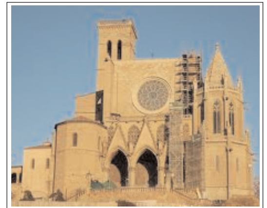
SANTA MARIA DE MANRESA. LA SEU.

Edifici gòtic, situat al cim del Puig Cardener on hi hagueren dues antigues esglésies, una de preromànica i una altra de romànica. La documentació de la primera època és molt escassa a causa de les ràtzies dels musulmans. La primera coneguda és de l'any 890 i preromànica. Entre el 914 i el 947, es consagrà el segon temple preromànic però en la ràtzia de Almansor, de l'any 999, fou totalment destruït. Tot seguit, s'inicià la construcció de l'església romànica. El 1020, rebé una dotació del comte Ramon Berenguer i la seva mare Ermessenda i de Oliba, bisbe de Vic. El 1035, passà a ser una canònica. Més endavant, s'havia d'introduir la reforma agustiniana, però no es va instaurar totalment fins el segle XIII. El 1592, se suprimiren les canòniques regulars i Santa Maria es convertí en col·legiata depenent del bisbat de Vic, excepte un curt període -1854-1884- en què en perdé tal condició. Avui encara la manté. Jeràrquica-