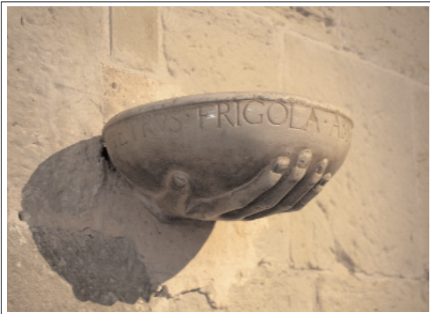
Pila baptismal de l'abat Frigola, situada al claustre del monestir de Sant Benet de Bages.

A l'angle sud-oest del claustre, dins la galeria, en l'arc que reforça l'angle, hi ha un capitell amb una inscripció a la part alta on llegim: "ACONDI-TOR OP(ER)IS VOCA-BAT (UR) B(ER)NAD", la qual és interpretada com la identificació del promotor de l'obra del claustre que, segons F. Español, podria referir-se a l'abat Bernat Sanespleda, documentat l'any 1225.