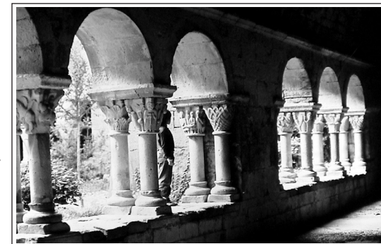
SANT BENET DE BAGES.

Els 64 capitells, són ornats, majoritàriament, amb temes vegetals, fulles d'acant, palmetes, falguera, etc., d'entrellaços, zoomòrfics i historiatos. Quant a la forma n'hi ha tot un repertori des dels de la forma coríntia més tradicional fins als troncopiramidals i cúbics. També n'hi ha de tipus califal, els quals juntament amb un de troncopiramidal, el 13, es consideren aprofitats d'estructures arquitectòniques anteriors al claustre actual, possiblement del segle X. Dels de tipus califal en tenim un formant parella amb el 13, al claustre; un altre a la finestra més meridional de la sala capitular i un tercer que es guarda a la zona habitada pels propietaris. A les finestres de la sala capitular es van reutilitzar també dos capitells més, els quals s'han considerat tradicionalment imitacions, dels anteriors, fetes per artesans locals.