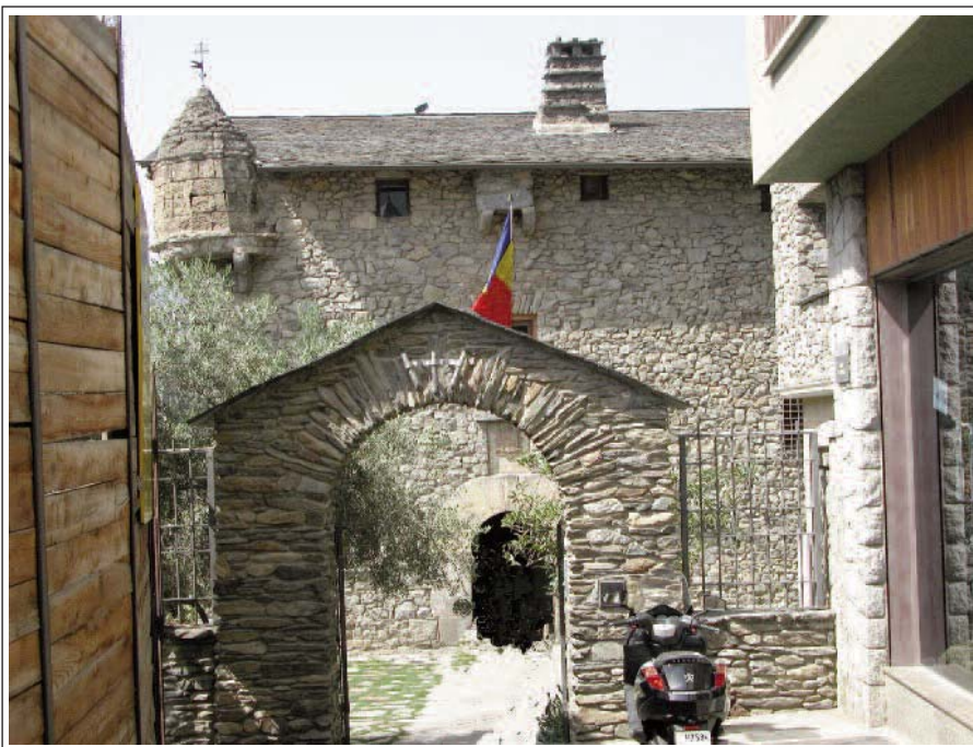
CASA DE LA VALL. Andorra la Vella.

Va ser construïda l'any 1580 com a casa pairal fortificada de la família Busquets. El 1702, fou comprada pel Consell de la Terra per utilitzar-la com la seva seu. Des del 2011, només s'utilitza per les dues sessions protocol·làries, la resta es fan al nou edifici del Parlament Andorrà. L'edifici, de planta rectangular, té baixos i dos pisos. Als baixos hi ha el Tribunal de Corts (administració de justícia). Al primer pis hi trobem: la Sala del Consell, la capella de Sant Ermengol, l'Armari de les Set Claus (per guardar els documents històrics