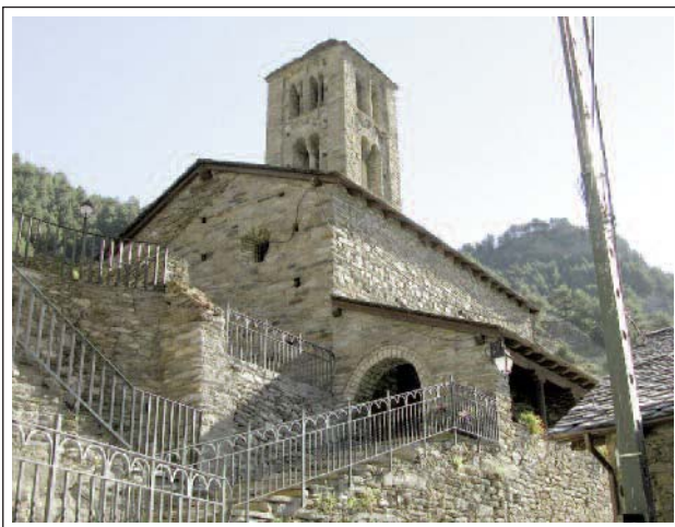
SANT CLIMENT DE PAL.

A finals del segle XVII o principis del XVIII s'efectuaren reformes: el costat nord fou ampliat amb capelles i dependències, l'absis va ser transformat en quadrat i el 1709 s'hi col·locà un retaule barroc. A l'interior del temple també hi trobem una pica baptismal, una pica per l'oli, dues creus processionals de fusta policromada i