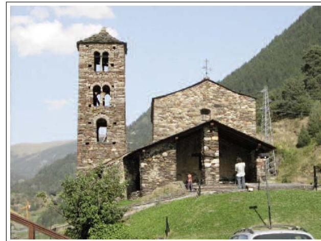
SANT JOAN DE CASELLES.

El lloc ja està documentat l'any 1162, en canvi l'església no consta fins el 1312. Per les seves característiques constructives es creu que s'inicià al segle XI i s'acabà al XII. El temple és d'una sola nau, un xic trapezial, coberta amb encavallades de fusta i capçada per un absis semicircular, construït amb posterioritat a la nau. La porta d'accés, molt senzilla, s'obre al mur nord, ja que el sud dona a un penya-segat. Hi ha dos senzills porxos que també són posteriors. La torre campanar inicialment era independent i s'hi accedia des de l'exterior. Més tard es construï una petita cambra amb volta de canó, que la uneix a la nau. El campanar és de planta quadrada i consta de tres pisos, tots amb finestres, la majoria són geminades.