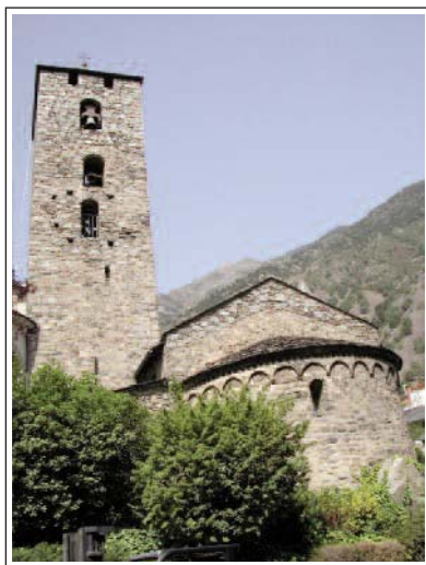
SANT ESTEVE D'ANDORRA LA VELLA.

una reixa de ferro procedent del cementiri (tot és del segle XII). També hi ha una talla de Nostra Senyora dels Remeis del segle XIII.