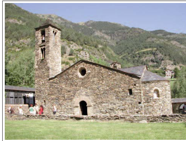
SANTA MARIA DE LA CORTINADA.

El lloc es troba documentat l'any 1162. L'església, en canvi, no consta fins el 1312, però ja existia al segle XI-XII, tal com revelen les pintures murals. La primitiva església romànica estava orientada d'est a oest. Era d'una sola nau, coberta amb volta de canó, capçada per un presbiteri (amb arcs torals i formers)