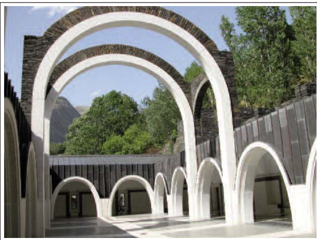
SANTUARI NOU DE MERITXELL

El santuari vell era un temple del segle XVI, d'origen romànic. Tot i que va ser destruït per un incendi l'any 1972, se'n va restaurar una petita part. El santuari nou, projectat per Ricard Bofill, s'inicià l'any 1974 i s'inaugurà el 1976. És d'estil eclèctic. Consta d'una nau de creu grega coberta amb volta de canó i un absis quadrat.