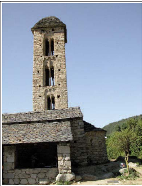
SANT MIQUEL D'ENGOLASTERS.

Inicialment era d'una sola nau, coberta amb embigat de fusta i capçada per un absis quadrat. Al segle XII, s'hi efectuaren algunes reformes: un petit allargament de la nau, l'actual capçalera i, el més important, es bastí l'alta torre campanar. L'absis és semicircular i de reduïdes dimensions. Exteriorment està decorat amb arquets cecs, sense lesenes. La porta, molt senzilla, s'obre al mur sud i disposa d'un pòrtic (l'actual, no és l'original, sinó que és més tardà). El campanar, molt esvelt, és de planta quadrada i està situat al mur nord. Consta de tres pisos, tots ells amb finestres geminades a les quatre cares. Els mainells estan formats per una columna i un capitell trapezial. La decoració és amb arcuacions cegues. Està cobert per una piràmide quadrangular.