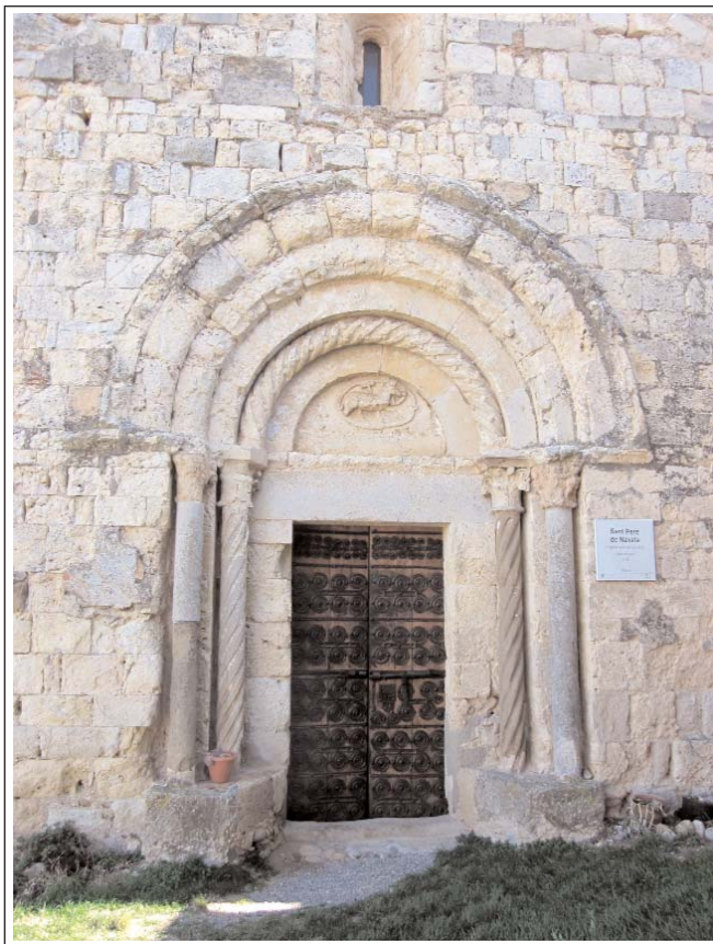
SANT PERE DE NAVATA. Portal i façana.

A la porta d'entrada es conserva la ferramenta, de clara tradició romànica. Forma un dibuix relativament simètric. Cada bastent de la porta està ornamentat per cinc jocs que segueixen les mateixes formes i mides, que consisteix en una cinta disposada horitzontalment, plana, que s'obre als extrems en forma de doble voluta, una recarbolada cap amunt i l'altra cap avall.