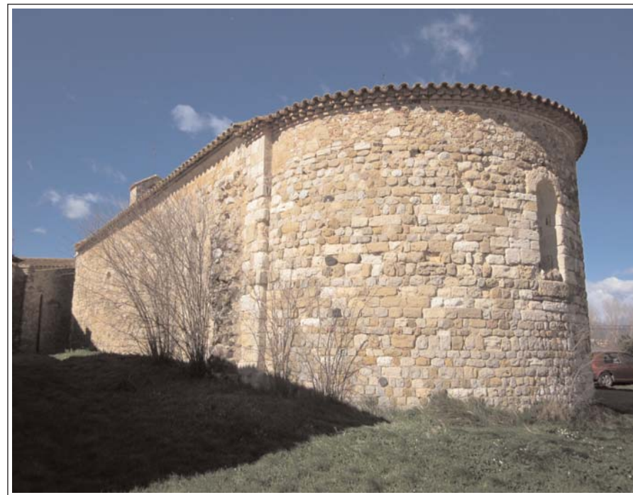
SANT PERE DE NAVATA. Absis.

La porta està formada de guardapols i quatre arquivoltes en gradació, sobre quatre impostes i un parell de columnes a cada banda, llinda i timpà.