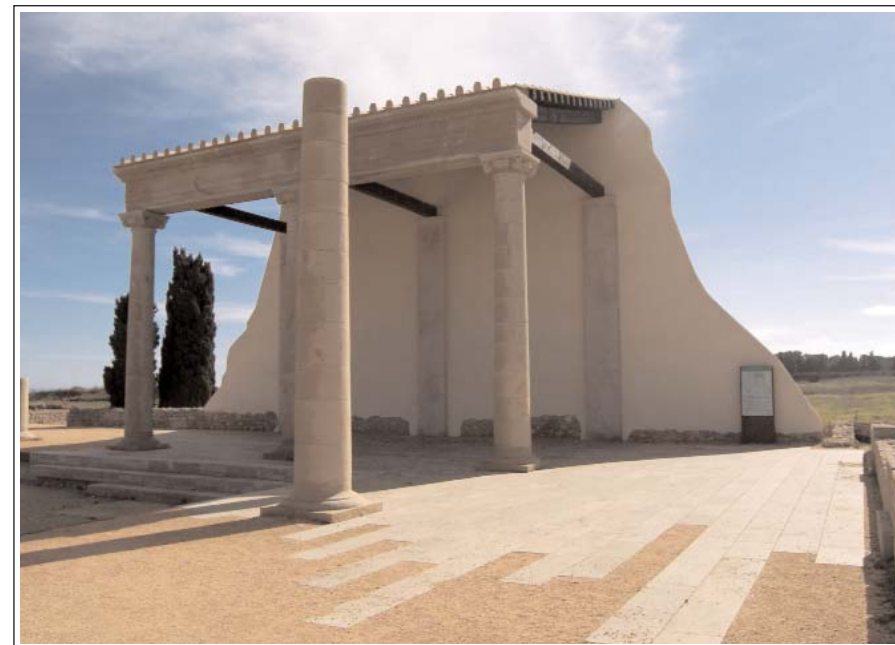
CIUTAT ROMANA D'EMPÚRIES. Reconstrucció del porticat a partir dels elements recuperats durant l'excavació.

En la majoria dels enterraments, com el descrit, s'ha trobat una moneda que, segons la tradició romana, permetia al difunt pagar al barquer Caront