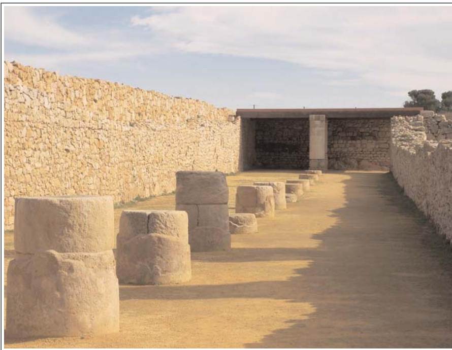
EMPÚRIES. Ciutat romana d'Empúries. Criptopòrtic del fòrum.

Els treballs arqueològics duts a terme al solar de la zona del centre de recepció de visitants del MAC Empúries, que han afectat una extensió de 2.460 metres quadrats i s'ha arribat als quatre metres de profunditat, han permès descobrir una necròpolis d'època romana alt imperial (segona mei-