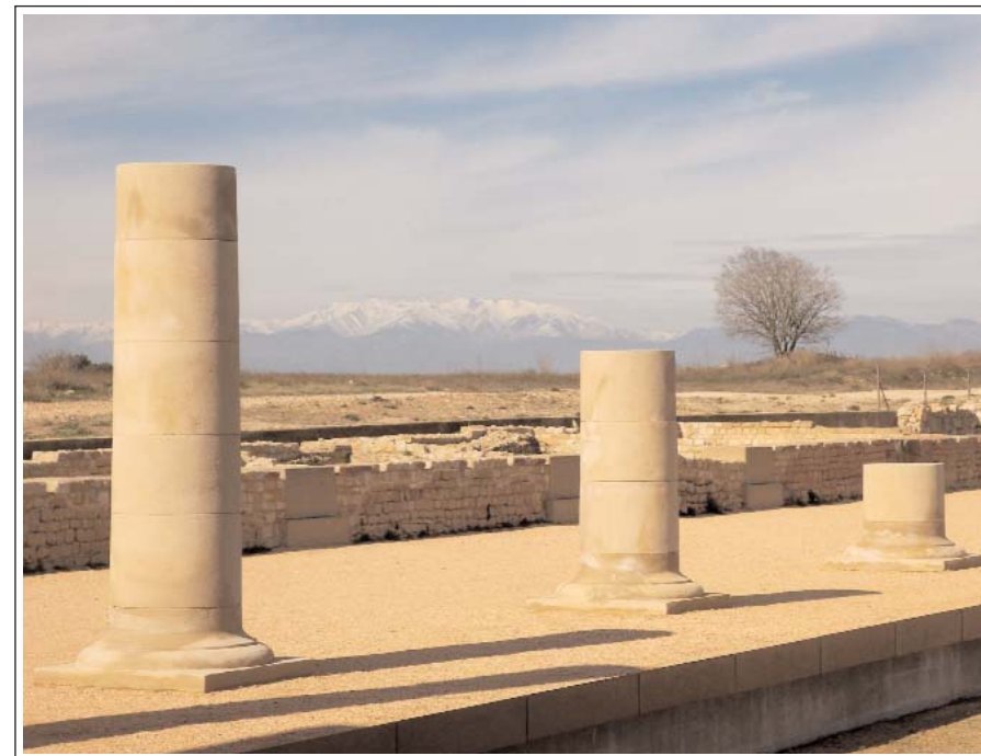
EMPÚRIES. El Forum, amb el Canigó nevat al fons.

La tipologia és diversa, i es poden veure cupas , tombes construïdes d'obra, amb una base massissa i un cos de secció semicilíndrica que forma la part central de l'estructura; tombes construïdes més senzilles, que conser-