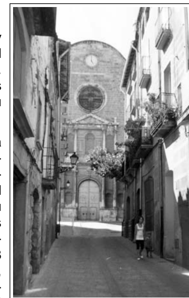
ALCOVER. Carreró que condueix a l'església nova.

És una típica vila medieval que encara mostra perfectament l'estructura urbanística antiga, alguns panys de muralles i portals com el de Saura i el de Sant Miquel, del segle XIV. També són testimoni del seu passat medieval els carrerons i les places porticades. L'edifici més significatiu és l'església vella. (en parlem a part). L'any 1578 s'inicià la construcció de l'església nova, fora muralles, consagrada a Nostra Senyora de l'Assumpció. L'obra va acabar el 1630, llevat del campanar que va caure el 1795 i que restà inacabat el 1803. A la comarca es diu que "el pantà de la Selva, l'ateneu de Prades i el campanar d'Alcover, mai no s'acabaren de fer" Té especial rellevància la capella del Santíssim d'estil neoclàssic. Altres edificis dignes de menció són l'ajuntament, Casa Cosme, l'Abadia i Casa Domingo i una munió més, fruit de l'auge econòmic i demogràfic que ha tingut la vila en diferents moments.