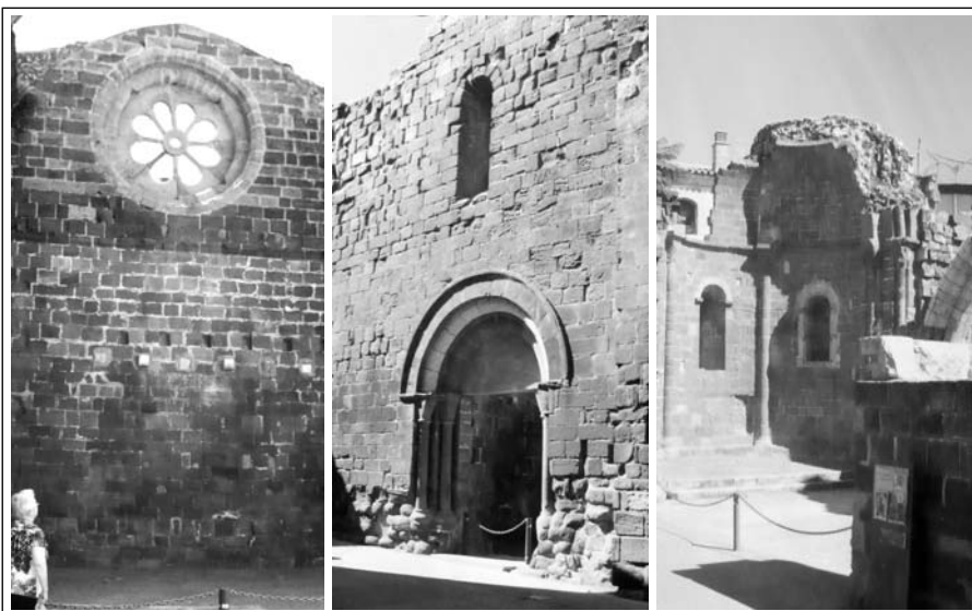
SANTA MARIA D'ALCOVER, església Vella, de la Sang, o Mesquita. Ruïnes.

Havia estat coberta per una volta de canó que se sustentava damunt d'una cornisa, encara visible, que ressegueix l'edifici interiorment. A sota de la cornisa hi ha deu capitells (vuit a l'absis i dos a la nau) i les columnes corresponents adossades als murs. La decoració que mostren esculpida es basa en figures humanes, animals fantàstics i decoració vegetal i geomètrica. L'absis té tres finestres de doble esqueixada amb una imposta esculpida amb motius geomètrics.