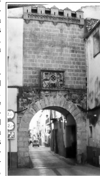
PLA DE SANTA MARIA. PORTAL DE CAL BRANCA.

L'edifici més notable és l'església romànica de Sant Ramon, situada en un extrem del poble, la qual ressenyem a continuació. També destaca l'actual església parroquial de l'Assumpció, d'estil barroc, amb un gran campanar de planta quadrada i torrassa octogonal amb balustres, l'edifici de la Cooperativa Agrícola, Ca la Marquesa, el grup d'habitatges de la fàbrica i la Casa Saperes. Tenen especial rellevància els portals medievals que tancaven la vila closa i el carrer Major o de la Vila, amb diverses cases pairals i portals de pedra treballada i els arcs dels carrers de la Trinitat i