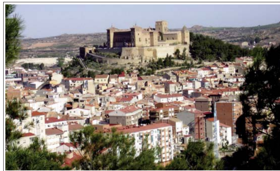
ALCANYÍS. Vila i castell

Els ibers, i després els romans, poblaren un indret anomenat Alcanyís el Vell que, més tard, fou abandonat. En la ubicació actual, dalt d'un turó, els romans bastiren una fortalesa, però el poblament es creu que fou degut als