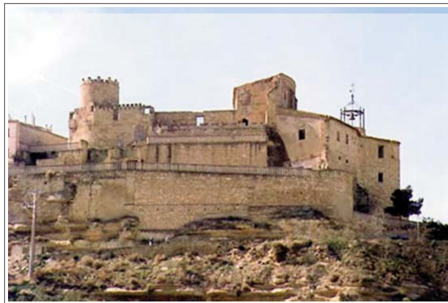
CASP. Castell del Batlle o del Compromís.

El primer assentament a la rodalia de l'actual Casp és dels sedetans , tribu ibera del segle III aC. El poblament es deu als musulmans, que construïren un important nucli de cases i una fortalesa al turó. La vila que s'originà posteriorment fou conquerida, l'any 1169, per Alfons el Cast que per mitjà d'una permuta la cedí a l'orde de l'Hospital. El castell fou reformat i ampliat per utilitzar-lo com a residència del batlle dels hospitalers. El 1392, Juan Fernández de Heredia, gran mestre de l'orde, va comprar la part de la vila que no era de la seva propietat i va fundar un convent. El 1394 aconseguí que l'església tingués la categoria de col·legiata i la dotà amb tresors i relíquies. La més important és la de la Vera Creu. Actualment la vila de Casp compta amb poc menys de 10.000 habitants.