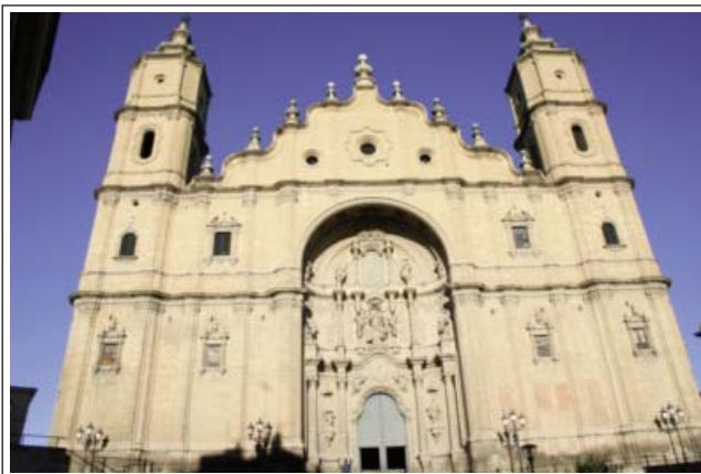
ALCANYÍS. Col·legiata de Santa Maria

El temple gòtic es construï al segle XIII. Avui només es conserva el gran campanar i alguns fragments. Constava de tres naus, la central més alta, capçades per un absis poligonal amb girola i capelles radials. La grandiositat de la torre campanar, es deu al desig de la vila d'erigir un símbol de poder davant del senyor del castell. L'any 1407, per mitjà d'una butlla papal, rebé la categoria de col·legiata, la qual mantingué fins al 1851. L'any 1732 s'adossà a la capçalera la capella de la Solitud per acollir les imatges de la Mare de Déu de la Solitud i del Sant Crist.