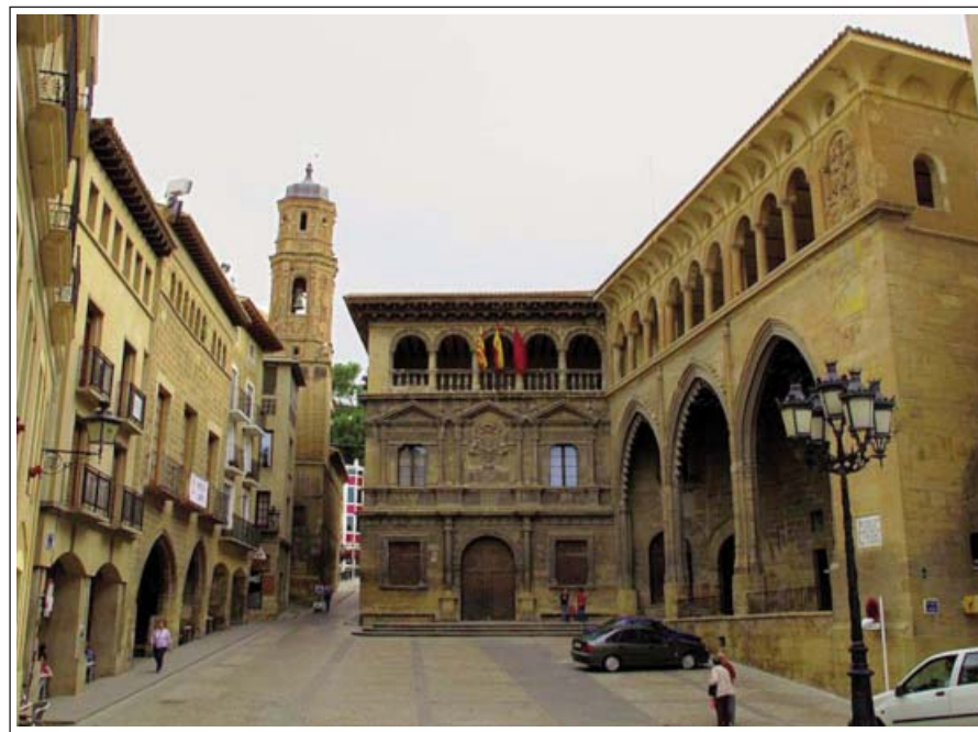
ALCANYÍS. Casa de la Vila i la Llotja.

Fou bastida al segle XVI, en estil renaixentista. Consta de planta baixa i dos pisos. La façana principal és amb carreus de pedra. A la planta baixa s'obre una porta de mig punt flanquejada per pilastres i dues finestres. Al