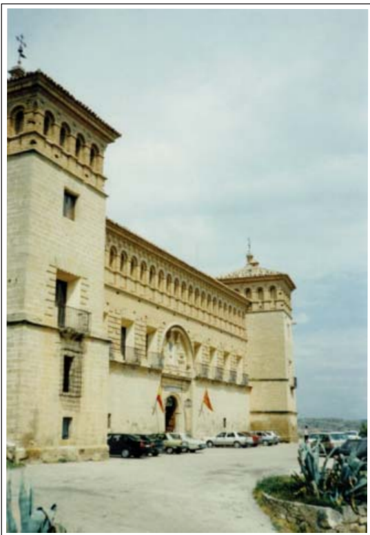
ALCANYÍS. Castell dels Calatraus.

Quant a les construccions de la zona sud són el fruit de les reformes i ampliacions més importants que es produïren al castell. Foren durant el segle XVIII per convertir-lo en un palau residencial, el "Palau dels Comanadors", d'estil barroc, amb una bonica façana principal. Va patir destrosses durant les diverses guerres. Els anys 1960 el palau es restaurà i es convertí en parador de turisme. Des de 1992 fins al 2001 s'han restaurat i condicionat la resta de les estances.