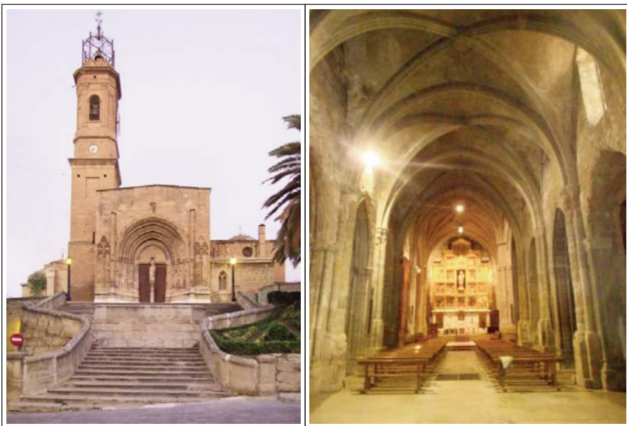
CASP. Col·legiata de Santa Maria.

Després de la conquesta de la vila, la mesquita es convertí en la primera església cristiana. L'orde de L'Hospital construï el temple actual des de finals del segle XIV fins a inicis del XV. L'any 1394 es varen ampliar el creuer