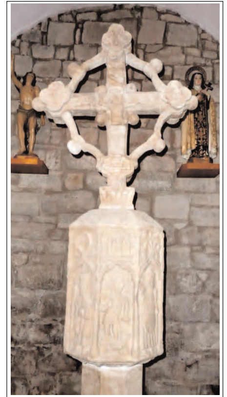
SANT PERE DE BELLVER D'OSSÓ. Creu gòtica amb fust octogonal conservada actualment a l'interior de l'església.

Situada actualment a l'interior de la nau, es troba una magnífica creu de terme gòtica del segle XIII. El fust i la base de la creu són octogonals, a cada cara de la base s'hi pot veure la figura d'un sant i a la creu, a una cara el Crist Crucificat i a l'altra la Verge amb l'Infant.