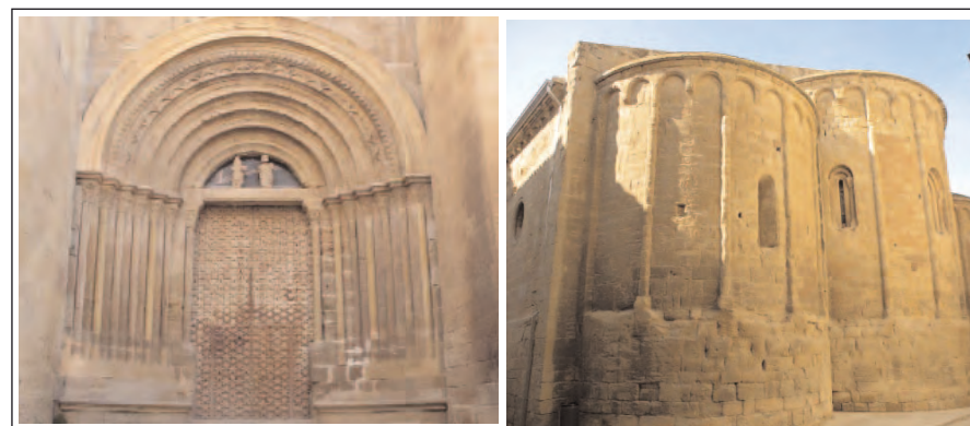
SANTA MARIA D'AGRAMUNT. Portal de la façana nord i Absis.

En el centre de l'arc, el 1283 s'hi adossà un grup escultòric de la Mare de Déu amb el Nen. A la seva esquerra l'Anunciació i a la dreta l'Adoració dels Reis – mostra, seguint els evangelis apòcrifs, les tres edats dels Reis-. Foren patronitzats pel gremi de teixidors d'Agramunt, per això, als peus de la Verge, hi ha unes llançadores.