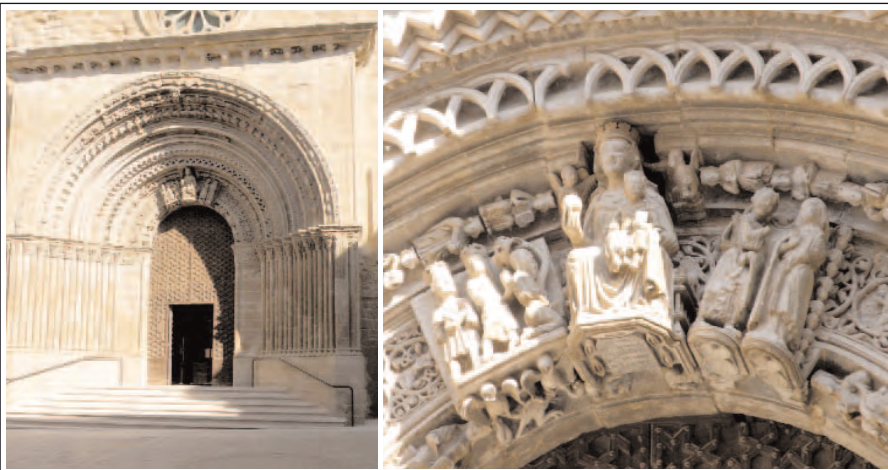
SANTA MARIA D'AGRAMUNT. Portalada principal i detall.

La vila d'Agramunt té el seu origen en el castell del mateix nom, documentat el 1051, ara desaparegut. Al seu voltant s'hi erigí la població. El comte d'Urgell Ermengol VII, atorgà el 1163 carta de població. A partir d'aquí, la vila adquirí gran importància i es començà la construcció de l'església de Santa Maria, que tingué un procés que s'estengué fins a la fi del segle XIII.