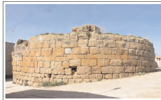
CASTELL LLIURÓ. Castellnou d'Ossó de Sió. L'estructura externa correspon a època romana, mentre que la de l'interior és d'època medieval.

Primer hi hagué una fortificació circular romana del segle II a.C –només en resta la meitat- ,amb aparell ciclopi de carreus encoixinats i ben escairats. El seu diàmetre és de 24m. i el mur de 2.8m. Al mig de la torre, en època medieval al segle XI, fou construïda una altra torre circular de 8.4m. de diàmetre, amb un mur d' opus emplecton que té 2.4m. de gruix.