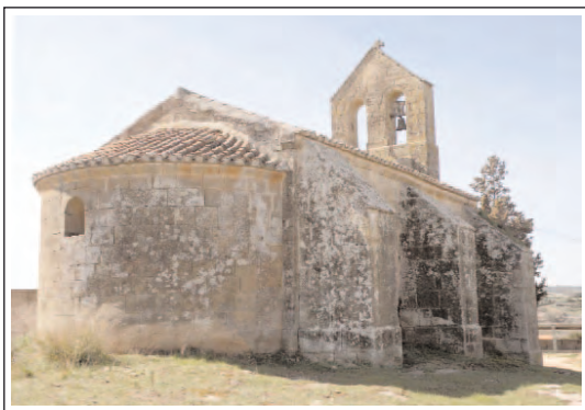
SANT PERE DE CASTELLNOU D'OSSÓ DE SIÓ. Aspecte de la capçalera i dels contraforts.

És d'estil romànic tardà, pel parament de carreus escodats i molt ben disposats, datable al segle XIII. És d'una sola nau amb absis semicircular, que té una finestra de doble esqueixada, precedit d'un estret arc presbiteral. La nau és coberta amb una volta de canó