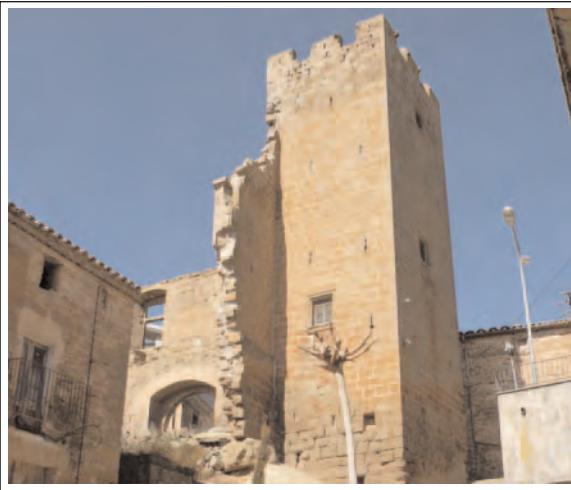
TORRE I RESTES DEL CASTELL DE CASTELNOU D'OSSÓ. L'única part ben conservada és la de la torre.