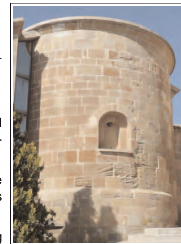
MARE DE DÉU DEL REMEI D'OSSÓ. Absis.

La finestra de l'absis té un arc de mig punt adovellat. La cornisa del ràfec està feta de pedres trapezoïdals bisellades, sense