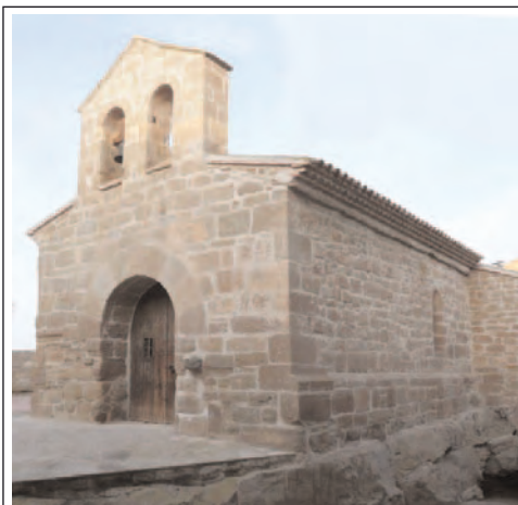
SANT MIQUEL DE PUIGVERD D'AGRAMUNT.

Situat a la part alta del poble, està documentat l'any 1061. Només en resta la façana on hi ha l'escut dels últims senyors, els Pinós, que també eren marquesos de Santa Maria de Barberà. La muralla es conserva tota perquè hi ha cases al damunt