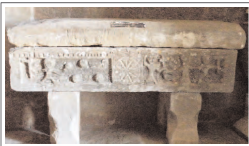
SARCÒFAG DE SANT PERE DE CASTELLNOU D'OSSÓ DE SIÓ. Datat a mitjan segle XII.

Frontal de la caixa: al centre, hi ha una creu esgrafiada dins d'un cercle-símbol cristològic i de redempció-. A l'esquerra, trobem una escena amb un escolanet que duu a la mà dreta una creu de tau -símbol del triomf de la vida sobre la mort-, a la mà esquerra un ram de flors i a mes, es troba en un camp de flors. A la dreta, hi ha tres ploraneres amb gest de desesperació. Les dues dels extrems porten una creu de tau.