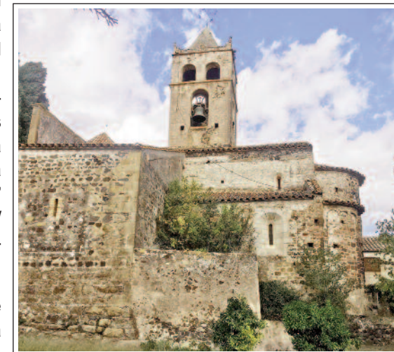
SANT VICENÇ DE CANET D'ADRI.

I és que l'església de Sant Vicenç és esmentada l'any 822 i va ser construïda damunt d'un temple romà-