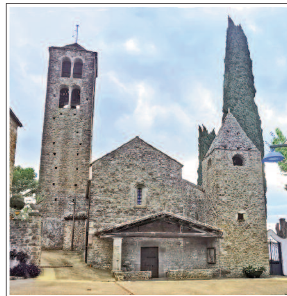
SANT PERE DE LLORÀ.

L'edifici actual el formen el cos central de l'església amb el campanar al nord, un comunidor de torre al sud i un gran porxo damunt del portal.