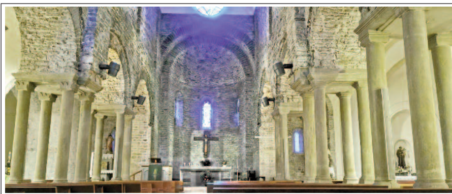
SANTA MARIA D'AMER. Interior, amb les pilastres dels arcs substituïts per grups de quatre columnes.

Les primeres notícies que tenim de Santa Maria d'Amer són de l'any 844, i del monestir del 949. Durant els primers segles tenia de nou a tretze monjos i un patrimoni extensíssim. La crisi s'inicià al segle XIV, a causa de la pesta i més tard pels terratrèmols del 1425 i 1428. Al segle XVI -guerra dels Segadors- algunes dependències van ser destruïdes i amb la desamortització va acabar en mans particulars, mentre l'església esdevenia la parroquial del poble.