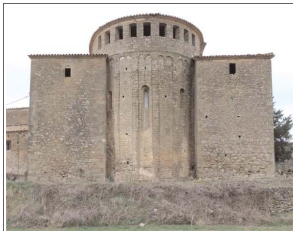
SANTA MARIA DE SERRATEIX. Absis central i capelles laterals.

Entre els segles XII i XIII, es produí la consolidació del monestir. El 1126 es va consagrar la nova església de Santa Maria i el seu domini era format per més d'un centenar de masos repartits pel Berguedà, la Cerdanya, el Bages, el Solsonès i la Segarra. Al segle XIV, la comunitat entrà en un període de decadència, l'única donació fou la del rei de Mallorca – comte de Cerdanya -, però, en canvi, es realitzaren grans obres als edificis monàstics, a causa de les quals es varen veure obligats a vendre una part de les seves propietats.