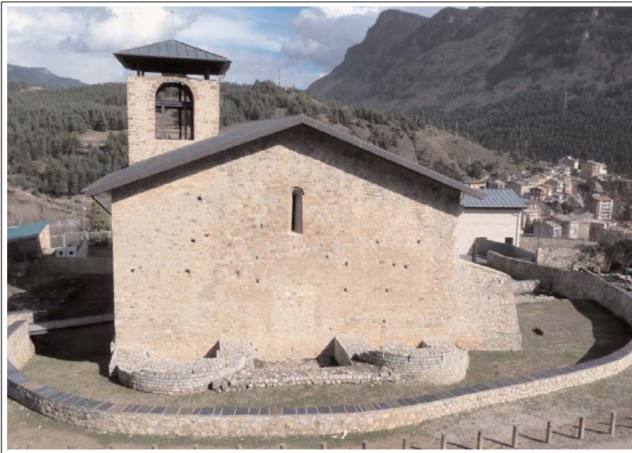
SANT LLORENÇ PROP BAGÀ (Guardiola de Berga). Façana de ponent amb el fonament de les absidioles, situades al lloc oposat de l'habitual.

capçalera, entre les dues absidioles, a manera d'un absis major. Planta i cripta estan comunicades des de l'interior del temple, per escales.