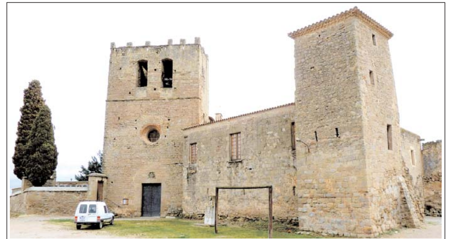
SANTA MARIA DE SERRATEIX. Façana principal.

En els primers documents, s'anomena aquest lloc com la Serra de Teix. L'any 941, es documenta una primera donació al monestir a la qual en succeïren d'altres. Gràcies a que els comtes de Cerdanya – Besalú, l'any 977, varen cedir al monestir els drets sobre les terres de la parròquia de Serrateix, es convertí en un dels monestirs més importants del comtat de Berga.