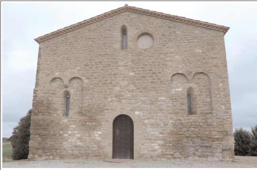
SANT PERE DE SERRATEIX.

Al segle XV o XVI, rebé una nova i gran transformació. S'anul·là la nau nord i es tapiaren els arcs formers, les naus central i sud foren convertides en una de sola, més ampla, tot eliminant les arcades de separació. Es van substituir les cobertes de canó de les naus per una de rajol i s'enderrocaren els absis.