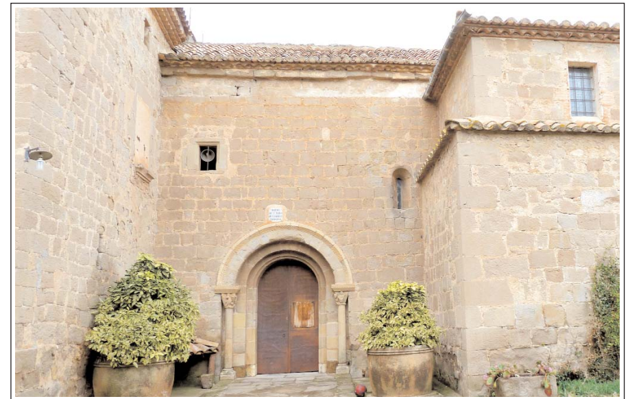
SANT PAU DE CASSERRES. Portal situat a la façana de migdia.

L'interior de l'església estava decorada amb pintures murals datades de mitjan segle XIII. Les d'un arcosoli del presbiteri son actualment al Museu Diocesà i Comarcal de Solsona. Representen el pecat original, el judici final, sant Pau de Narbona i sant Cristòfol. Durant les obres de restauració de l'any 1979 aparegué un nou fragment de pintura mural al mur sud de la nau, amb una escena de la mateixa temàtica, la representació del pesatge de les ànimes. Hi manca l'arcàngel Miquel defensor de les bones, però hi ha representat el dimoni que intenta aconseguir-ne més de pecadores decantant-ne la balança.