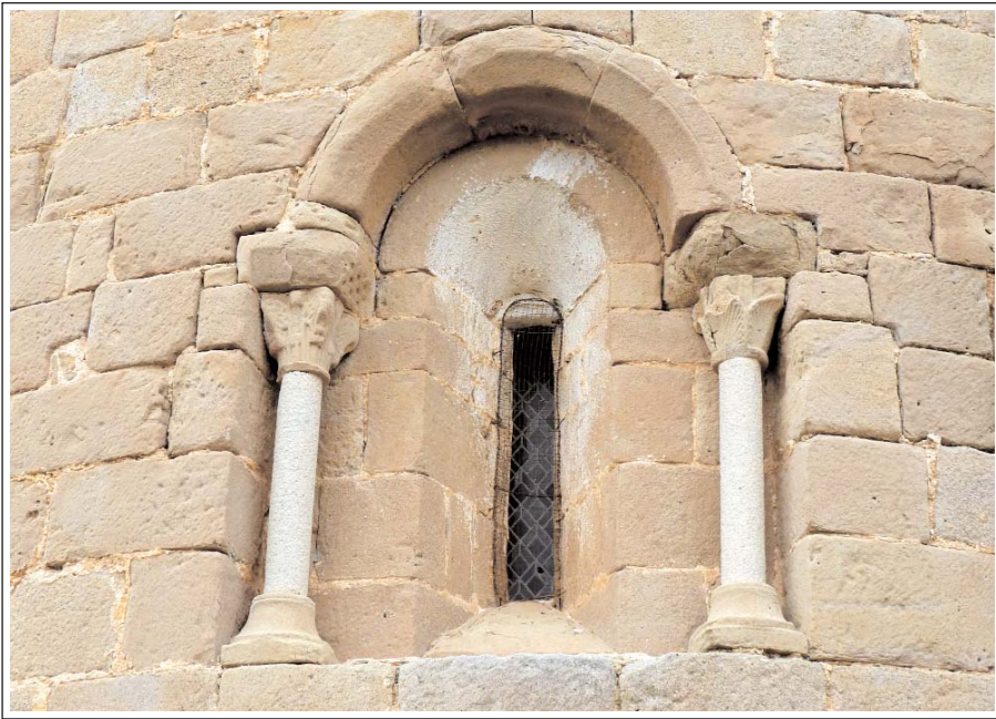
SANT PAU DE CASSERRES. Finestra de l'absis.